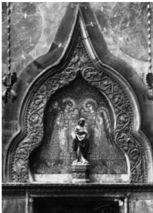
1. Porta del Tesoro, Venezia, San Marco

l'opinione dello studioso veneziano, secondo cui il motivo aveva un'origine locale. Egli osservò che l'arco mistilineo era stato impiegato a Firenze nella cosiddetta "Porta d'Oro" della chiesa di Orsanmichele nel 1408, tre anni prima della sua comparsa a Venezia sulla tomba di Agnese e Orsola Venier nei Santi Giovanni e Paolo, ritenne il fastigio della tomba Venier un "embrione" o una "maldestra imitazione" dell'arco mistilineo fiorentino (di cui ricostruì la discendenza), ed evidenziò i caratteri fiorentini delle opere veneziane che lo inclusero successivamente: l'altare della Cappella dei Mascioli in San Marco e la Porta della Carta.