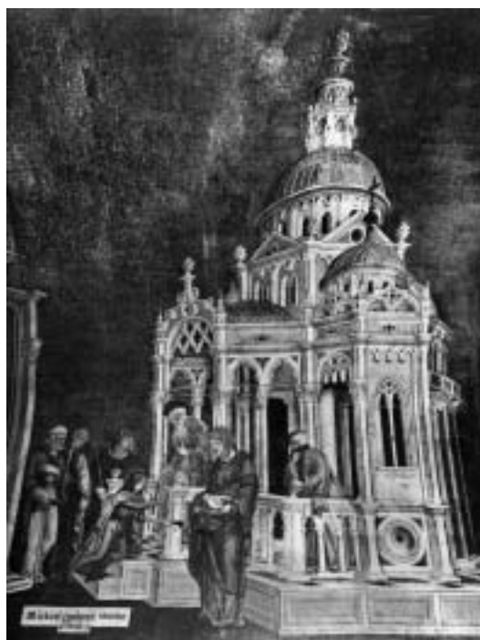
7. Michele Giambono, Presentazione della Vergine al Tempio , Venezia, San Marco, cappella dei Mascoli

Il coronamento mistilineo del portico è infatti posto sopra un arco con trafori, il cui disegno riprende quello della loggia del Palazzo e richiama, anche per il coronamento, la Porta della Carta, l'entrata cerimoniale realizzata negli anni precedenti (fig. 8).