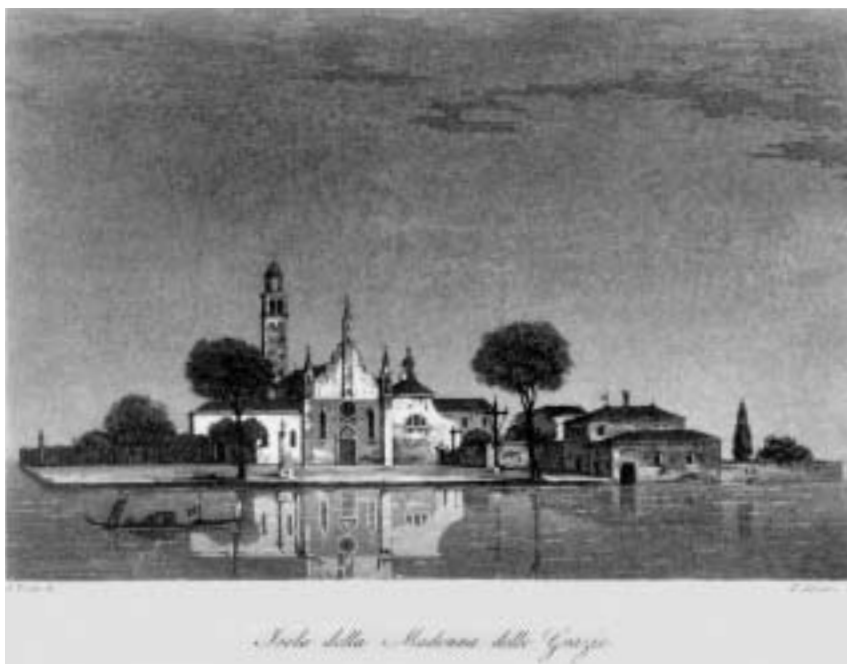
15. Isola della Madonna delle Grazie (Venezia, Gabinetto Disegni e Stampe del Museo Correr, St H 16, tav. 85)