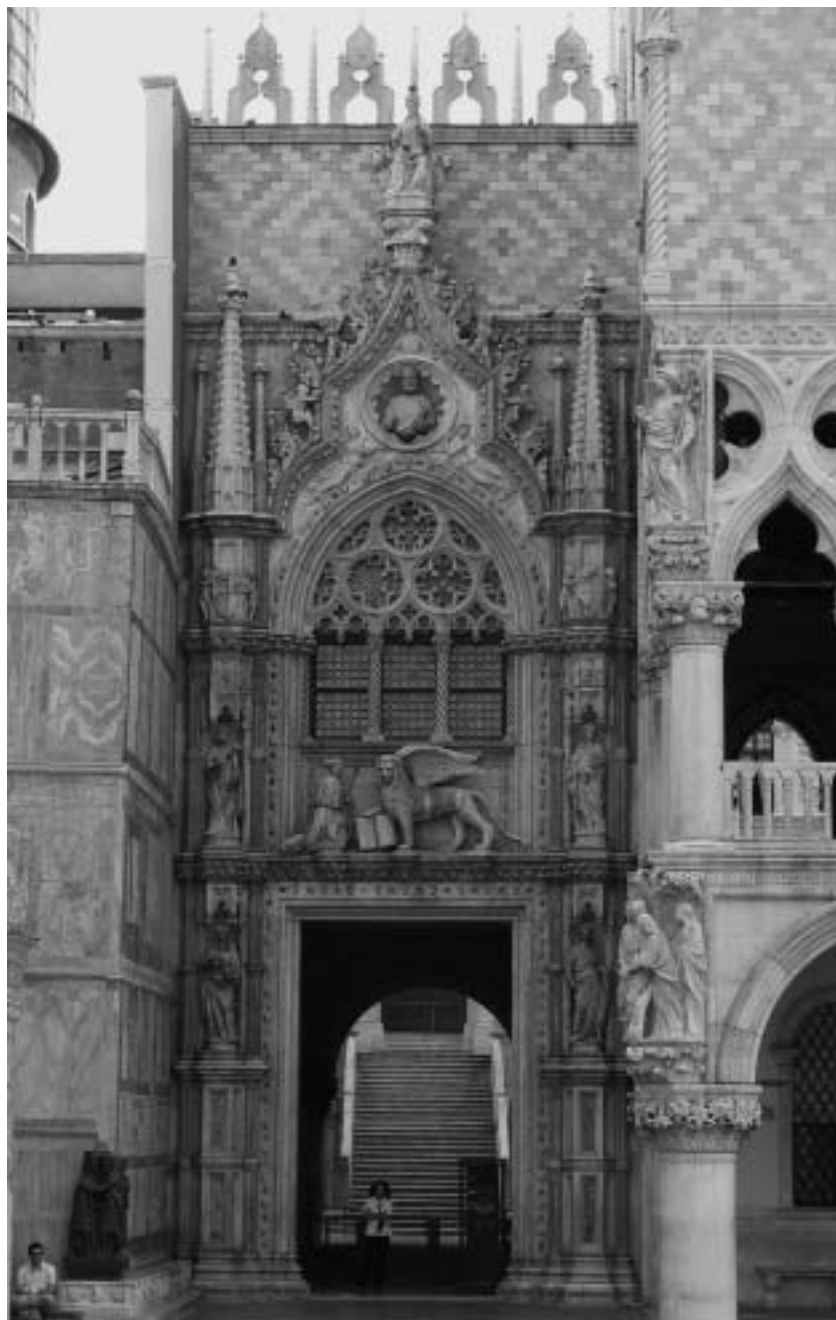
8. Bartolomeo Bon, Porta della Carta, Venezia