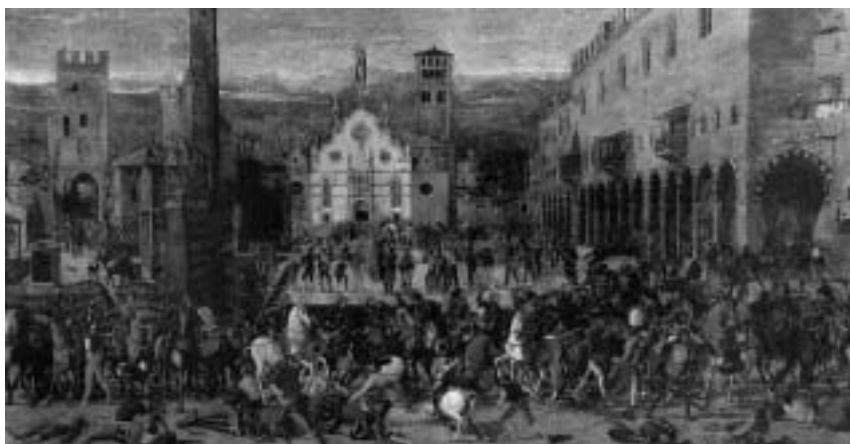
10. Domenico Morone, La cacciata dei Bonacolsi , Mantova, Museo di Palazzo Ducale, 1494

Crocefisso ligneo miracoloso del santuario del Volto Santo del duomo di Lucca era inserita, insieme alle figure ai suoi piedi della Vergine col Bambino, san Martino e san Michele arcangelo, nella sezione inferiore della torre centrale di un'architettura celestiale composta da registri di tabernacoli popolati da figure di santi. I tabernacoli avevano varie fogge di coronamenti, incluso quello mistilineo. Tralci con busti raccordavano l'edificio alla cornice dell'imponente altare, culminante con un arco inflesso o "a schiena d'asino" dalla forma piuttosto schiacciata, sorretto da settori circolari tramite un raccordo ad angolo retto. 34