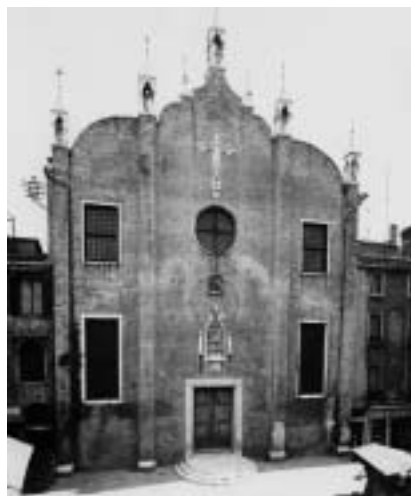
14. Sant'Aponal, Venezia