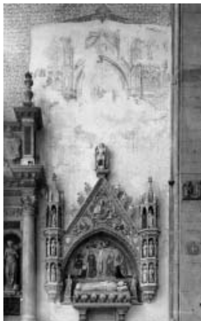
4. Tomba del doge Michele Morosini, Venezia, Santi Giovanni e Paolo