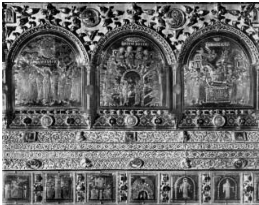
2. Pala d'Oro, Venezia, San Marco

gelista, all'interno, nel transetto nord verso l'atrio. 7 Nelle lunette degli arconi laterali della facciata principale si trovano invece archi rialzati e inflessi (nella Porta di Sant'Alipio in associazione a transenne di finestre vicine all'arte fatimita). 8 Poiché la chiesa custodiva le spoglie di san Marco, martirizzato e originariamente sepolto ad Alessandria, la