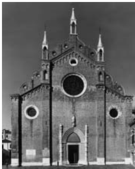
19. Santa Maria Assunta dei Frari, Venezia

to a modello per quelle della chiesa di San Lorenzo a Laterza (forse fra 1470 e 1479) e della cattedrale di Mottola (1507). 46