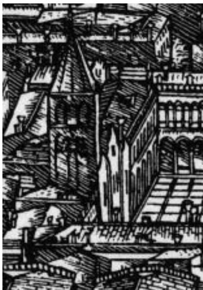
11. Jacopo de Barbari, veduta prospettica di Venezia, dettaglio con la chiesa di San Geminiano