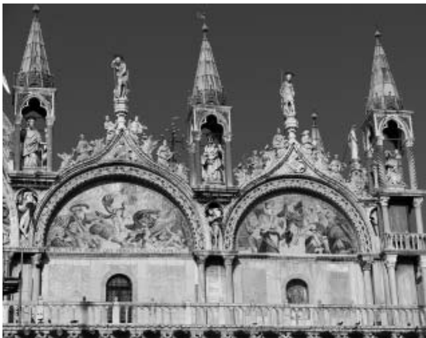
3. San Marco, Venezia, dettaglio della facciata

ripresa di questa forma esotica, tratta dal repertorio decorativo islamico, è apparsa significativa: avrebbe richiamato la storia del santo e indicato l'edificio come il suo "autentico" sacrario. 9 Non va comunque escluso che nella scelta degli archi inflessi siano stati tenuti presenti i reliquiari, considerati i diversi aspetti che la basilica marciana condi-