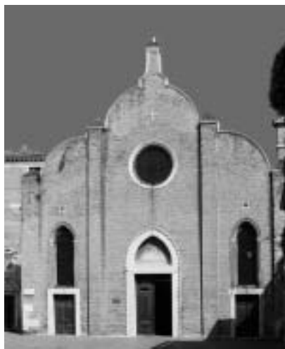
16. San Giovanni Battista in Bragora, Venezia