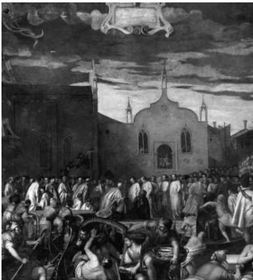
18. Carletto e Gabriele Caliari, Il doge Sebastiano Ziani incontra Alessandro III davanti a Santa Maria della Carità , Venezia, Palazzo Ducale, Sala del Maggior Consiglio