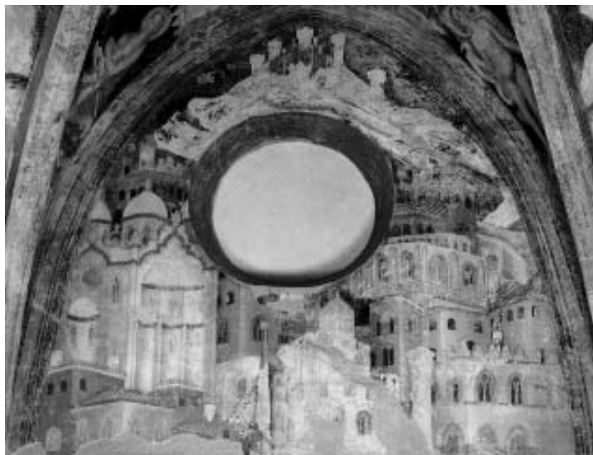
17. Pittore anonimo vicino a Gentile Da Fabriano, Veduta di città , Pordenone, duomo, Cappella Ricchieri

aggiunto decorazioni mistilinee alla facciata della basilica dei Frari, rendendola di fatto più veneziana (fig. 19). 44