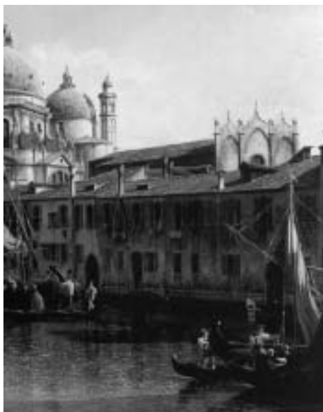
13. Bernardo Bellotto, Il Canal Grande da Santa Maria del Giglio , dettaglio, ca 1740, Los Angeles, The J. Paul Getty Museum

Un coronamento simile fu impiegato nella facciata del duomo di Mantova innalzata fra il 1395 e il 1403 su progetto di Pierpaolo e Jacobello delle Masegne, di cui resta testimonianza in un dipinto di Domenico Morone nel Palazzo Ducale di Mantova (fig. 10), e per quella della basilica jemale di Santa Maria Maggiore a Milano, ricostruita dopo il crollo del 1353 e ricomposta nel tardo Quattrocento nel corso della costruzione della nuova cattedrale, riprodotta in sigilli, insegne e