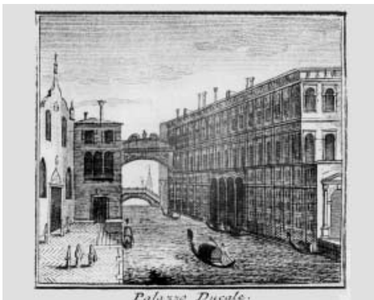
12. Il Rio di Palazzo con la chiesa dei Santi Filippo e Giacomo (da Forestiero illuminato ... , Venezia 1775)