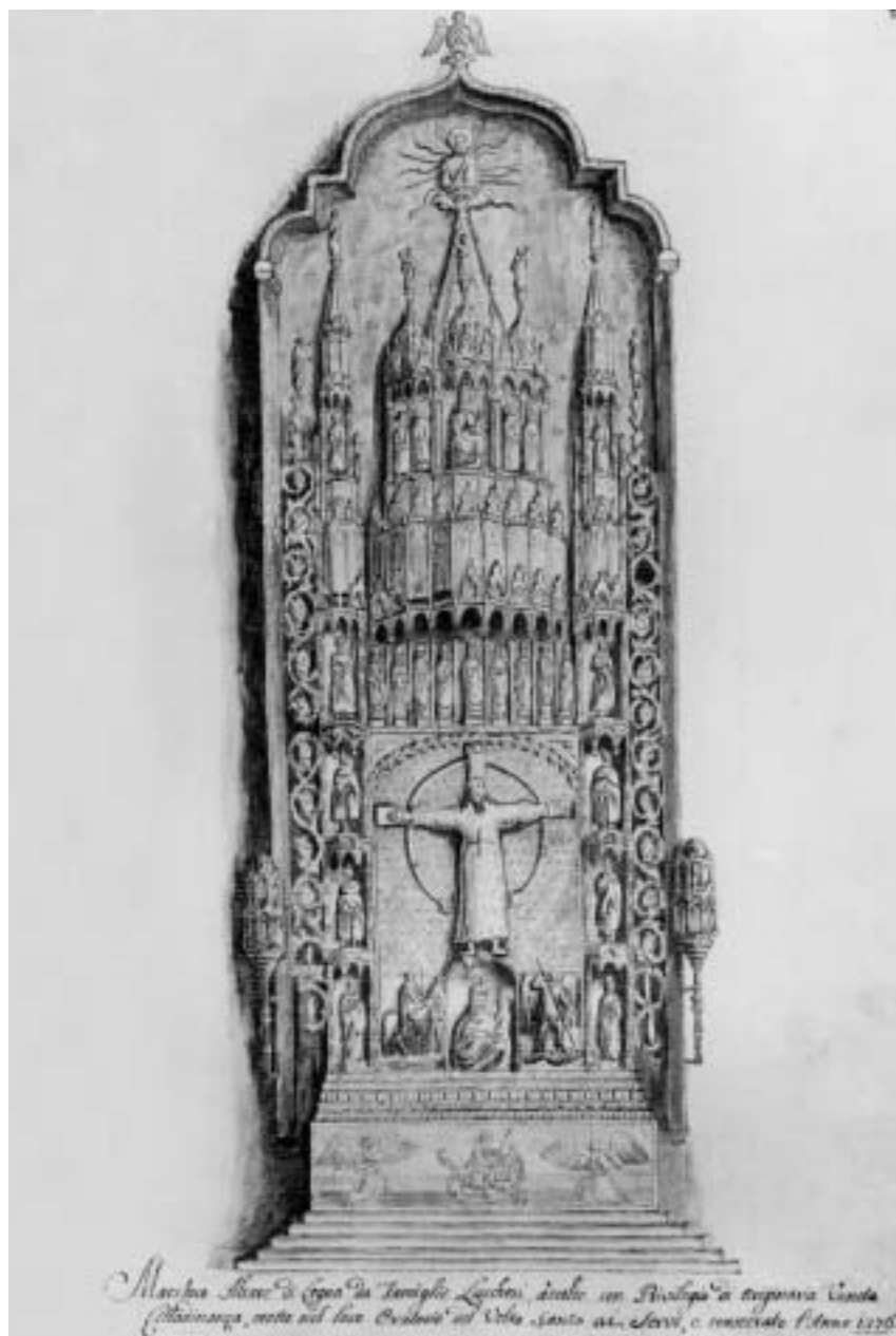
9. Altare del Volto Santo, Venezia, Santa Maria dei Servi (disegno di Giovanni Grevembroch, da Monumenta veneta ..., 1754, I, Venezia, Biblioteca del Museo Correr, cod. Gradenigo-Dolfino 228)